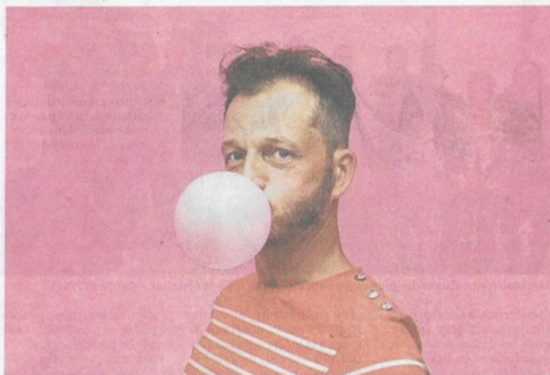
Le chanteur à la marinière rhabille, pour l'hiver à venir, la chanson d'amour, dans l'esprit facétieux cher à son personnage.